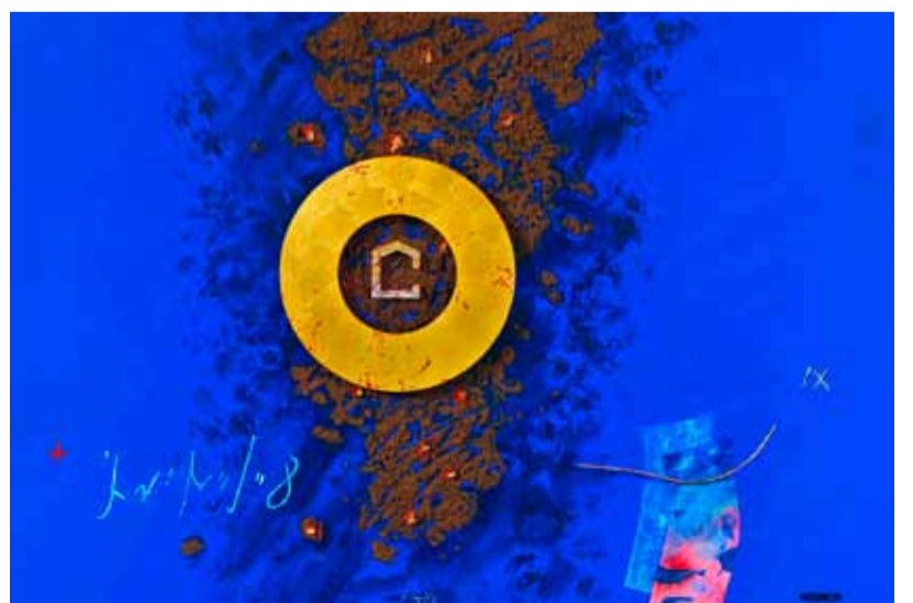
Das MISEREOR-Hungertuch 2019/2020: «Mensch, wo bist du?» von Uwe Appold © MISEREOR